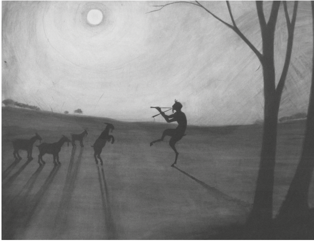
Léon Spilliaert (1881-1946) "Fauno al chiaro di luna" (1900)