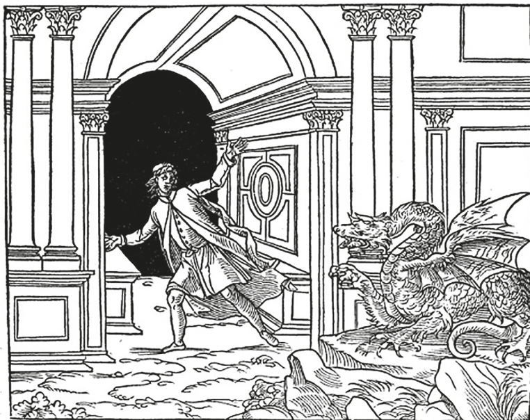
Hypnérotomachie, éd. Martin, 1546, tavola 19v.