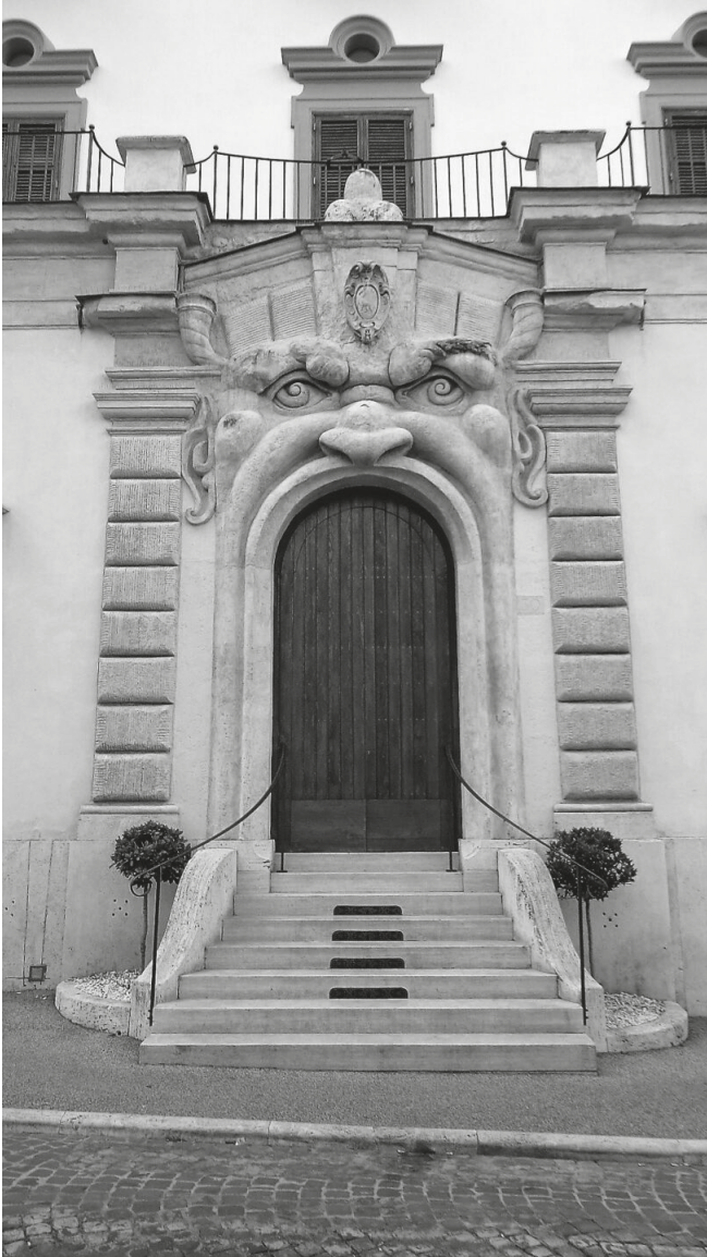
Una foto del portone di Palazzo Zuccari a Roma (facciata sulla via Gregoriana).