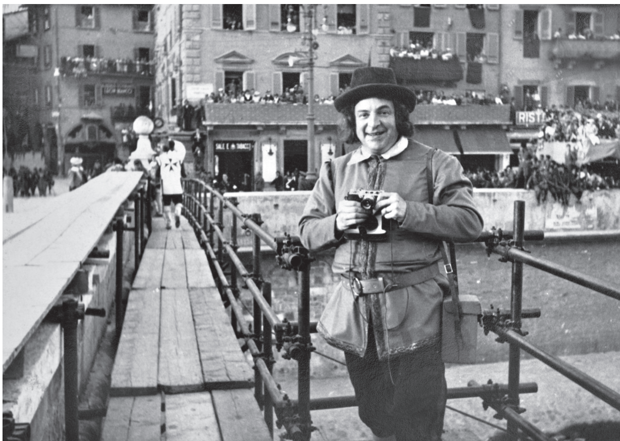
Guido Allegrini fotografa il Gioco del ponte del 1935.

A distanza di un secolo dalla marcia Palazzo Blu ha utilizzato molte di queste foto per realizzare la mostra "Immagini dal Ventennio"; al di là dell'esposizione temporanea, ci è apparso utile conservarne, in un'agile pubblicazione, molte fra le più significative, spiegandone il senso e facilitandone una più approfondita comprensione attraverso i saggi di valenti studiosi di quel periodo.