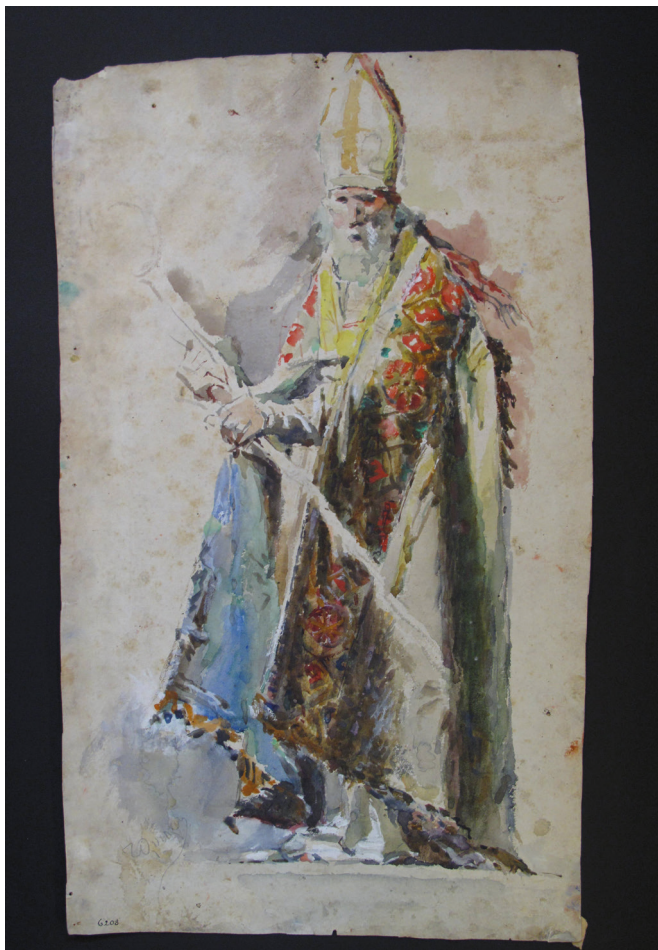
Fig. 22: Tullio Salvatore Quinzio, Vescovo , fine XIX sec., acquarelli colorati su carta, 527x307 mm. Genova, GDSPR, inv. D D6208.