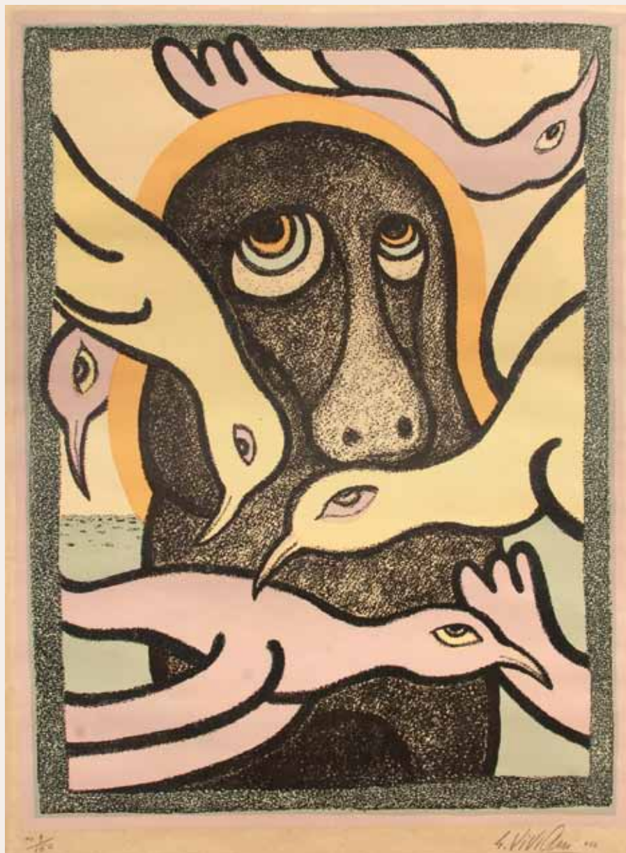
Cane e uccelli, 1961, litografia