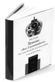
Félix Duque Terrore oltre il postmoderno. Per una filosofia del terrorismo a cura di Lucio Sessa ETS, pp. 94, €10

Luigi Bonanate Il terrorismo come prospettiva simbolica Aragno, pp. 118, €10