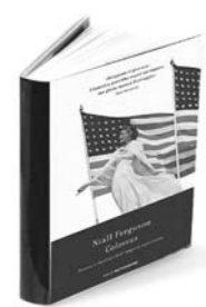
Niall Ferguson Colossus trad. di V. Pecchiar Mondadori, pp. 395, €20

Dunque un colosso, sì, ma dai classici piedi di argilla. Il che non vuol dire che l'impero, o l'egemonia globale, degli Stati Uniti d'America stia per finire. Né la Cina né l'Unione europea possono impensierirsi prima di qualche decennio, e la seconda forse mai. Lo stesso terrorismo islamista (frutto anche di errori americani, rileva l'autore) potrà infliggere altri danni, anche gravi, ma mai decisivi. E tuttavia resta, in questo libro singolare, non catalogabile nelle categorie politico-intellettuali dell'America del secondo Bush, il senso di una grande occasione storica mancata. A meno di un'imprevedibile mutazione, politica e quasi antropologica, delle classi dirigenti e dell'opinione pubblica. Che poi è difficile dire, realisticamente, se sia auspicabile.