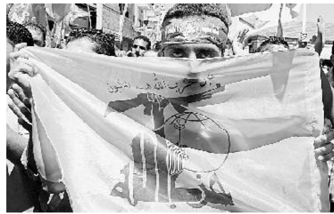
«Oscenità»: così definisce il terrorismo il filosofo spagnolo Duque

sche e il bue decapitato di Rembrandt richiamano la violenza originaria per esorcizzarla, allontanarla da noi con il suo stesso mostrarsi.