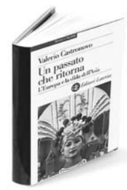
Valerio Castronovo Un passato che ritorna Laterza pp. 360, €19

Il lettore che segue questi percorsi, fra alti e bassi, fra gli scetticismi su Maastricht, i fervori per l'euro, l'inarrestabile