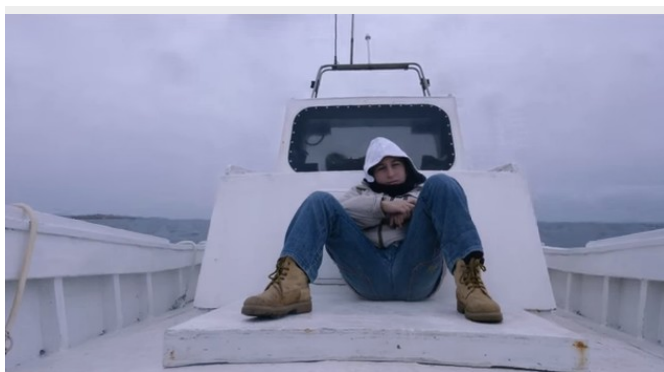
Fuocoammare (Rosi, 2016)

Immunitas e persona. La filosofia di Roberto Esposito di Salvatore Spina.