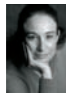
Laura Minestrone Il manuale della marca Fausto Lupetti, 320 pagine, 18 €

Un libro fedelissimo al suo titolo, ovvero un manuale che tratta ogni aspetto della (tanto postmoderna) marca (o brand), fenomeno centrale del neocapitalismo contemporaneo, e componente essenziale della comunicazione. Dalla brand identity alla brand community, tutto quello che c'è da sapere sulla marca e sulle novità da essa introdotte nel consumo e nel mondo produttivo, sempre più orientato nella direzione della relazione e dell'interazione.