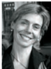
Elena Esposito Il futuro dei futures Edizioni ETS. 266 pagine, 18 €

Quanto tempo c'è, ed è incorporato, nella finanza? Elena Esposito, allieva del famoso sociologo tedesco Niklas Luhmann, e docente all'Università di Modena e Reggio Emilia, propone una riflessione filosofica sulla relazione tra la finanza e il tempo, a partire dai suoi strumenti più complessi, i futures e i derivati. Mostrando come i mercati finanziari, di fatto, acquistino e vendano futuro, permettendo di proteggere dai rischi, e come le crisi si generino proprio quando pare che il futuro sia già stato usato.